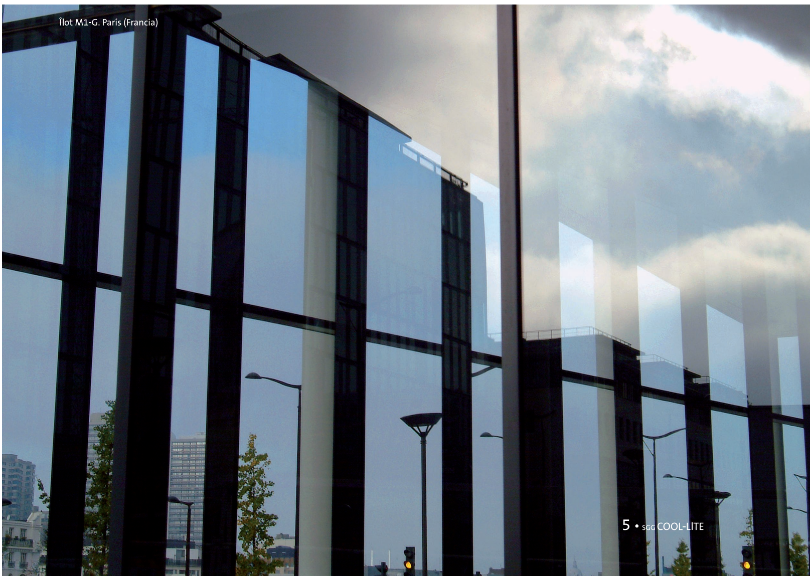
Îlot M1-G. Paris (Francia)