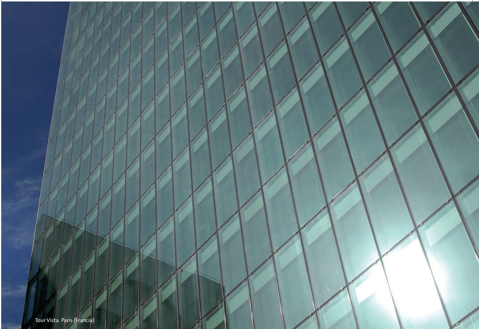
Tour Vista. Paris (Francia)